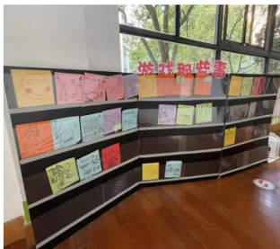
插片式链接式观察墙

链接式观察墙在使用过程中需考虑幼儿和教师操作简便，KT 板上可通过插片式、雌雄扣黏贴式、游戏故事册、夹板式等等不同的操作，这样既能让幼儿自主操作记录，方便展示游戏故事、游戏问题。作为一个幼儿自主分享、师生共享的移动墙面，除了集体分享解决共性问题外，餐后、自由活动等时间幼儿还可以和同伴互享，教师可以与幼儿一对一分享、记录，让游戏故事被“看见”、“听见”。