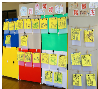
板夹式链接式观察墙

它还是游戏后教师观察幼儿游戏情节发展、幼儿交往行为、幼儿游戏问题的好帮手，通过观察墙中幼儿的共性问题进行集体分享、游戏经验共享，帮助幼儿解决问题。同时让教师“看懂”幼儿游戏行为，为